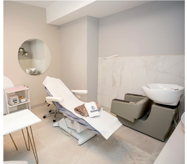
W naszym zespole mamy m.in lekarza medycyny estetycznej, trychologa oraz dietetyka.