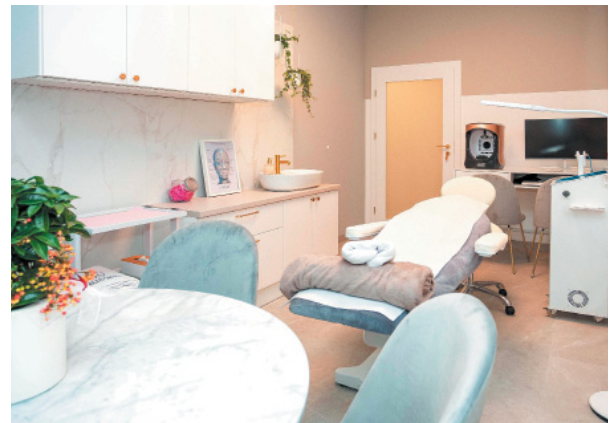
Pomieszczenia są przestronne, nowoczesne i dostosowane do pracy z pacjentem

lat na podjęcie decyzji o otwarciu kliniki. Po drodze były sytuacje, na które nie miałyśmy wpływu, jak na przykład pandemia. Jednak udało się i otworzyliśmy nasze wymarzone miejsce.